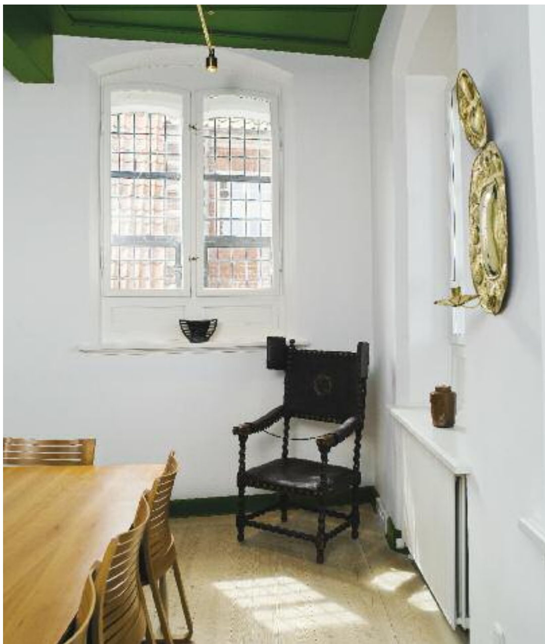
"Brorsons stol" – præstestolen fra domkirken i brug fra 1690'erne.