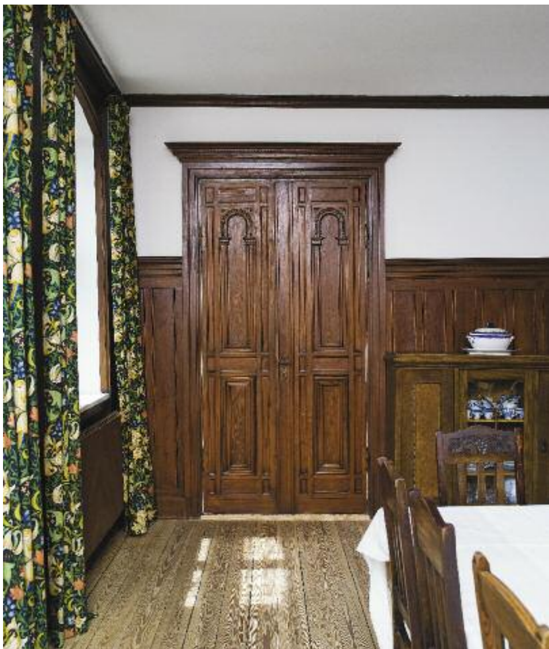
Tre bevarede renessancedøre dannede ved restaureringen i 1902-7 udgangspunkt for udformningen af lejlighedens øvrige døre.