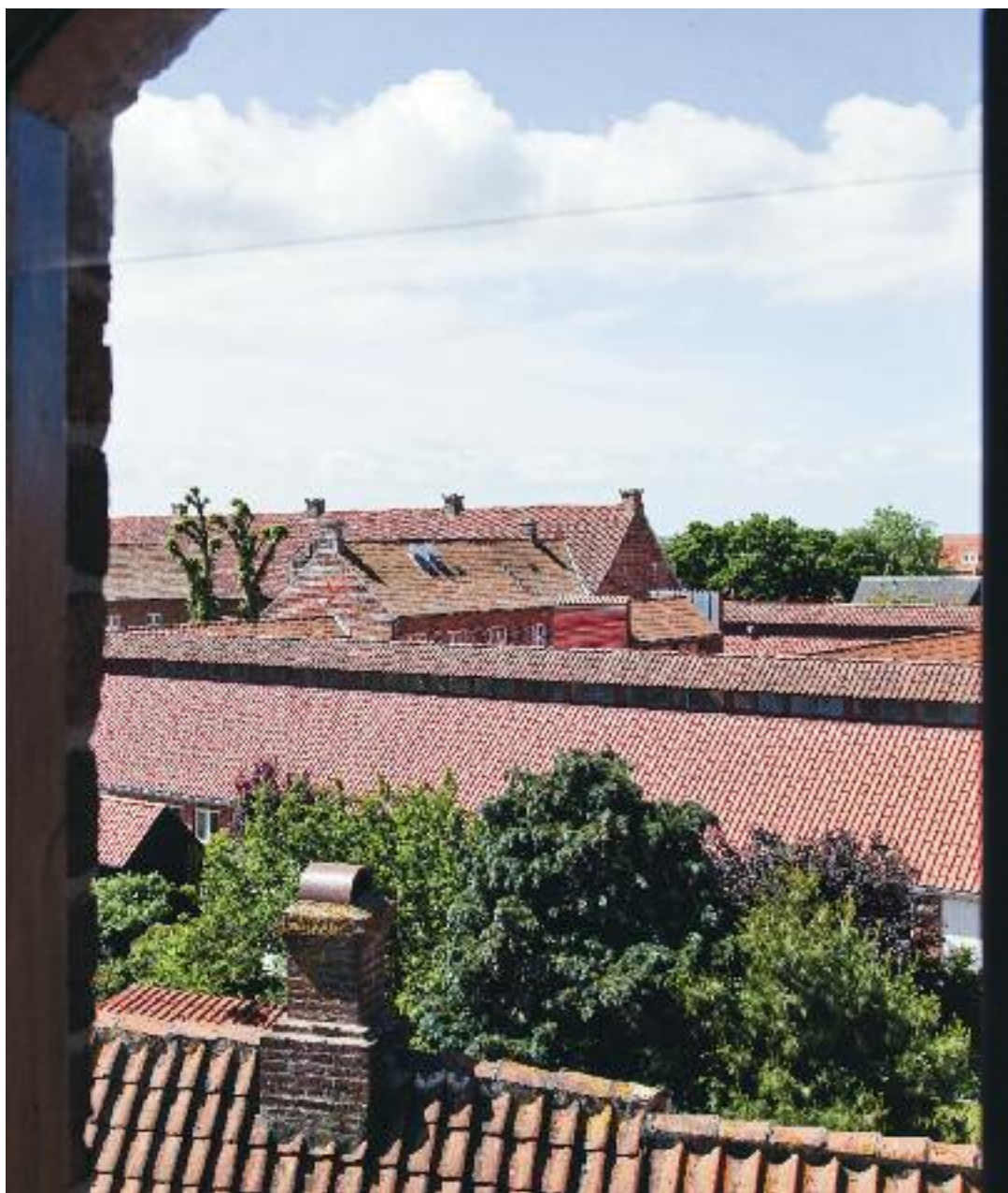
Udsigt over Ribes mange røde tegltage.