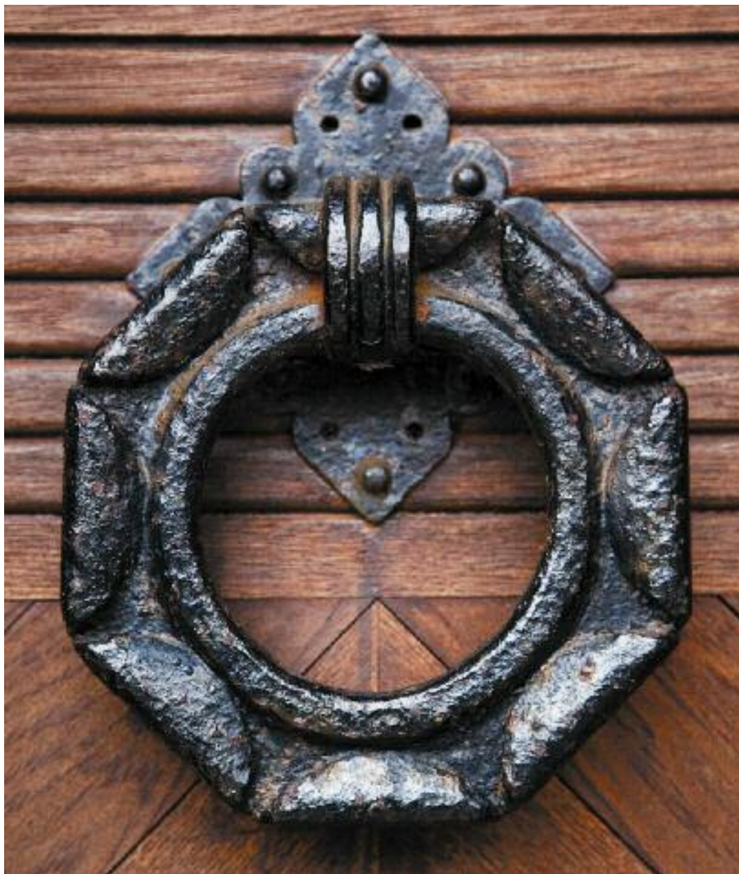
Dørhammer. Detalje fra døren i tårnet.