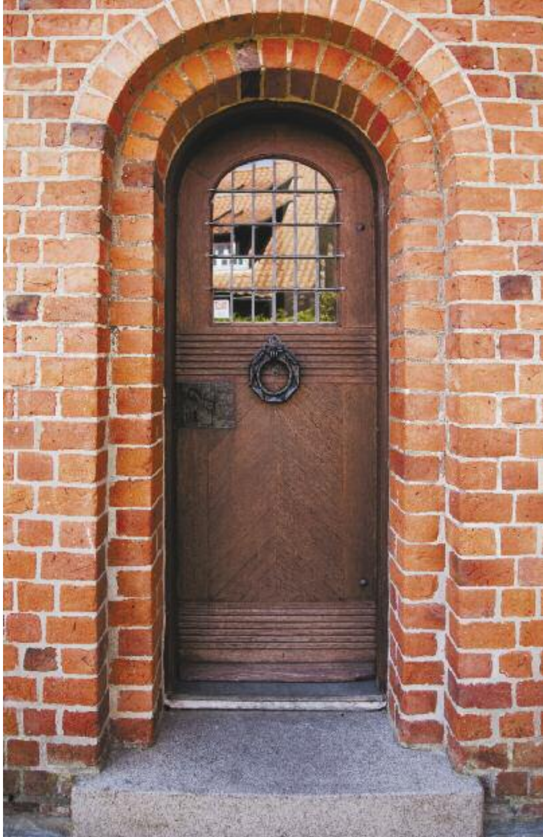
Indgangsdøren i tårnet er udført i egetræ og stammer fra arkitekt Ambergs gennemgribende restaurering i 1902-7.