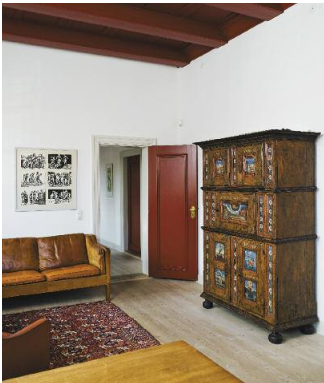
Kontoret, skab fra Schackenborg fra 1727.