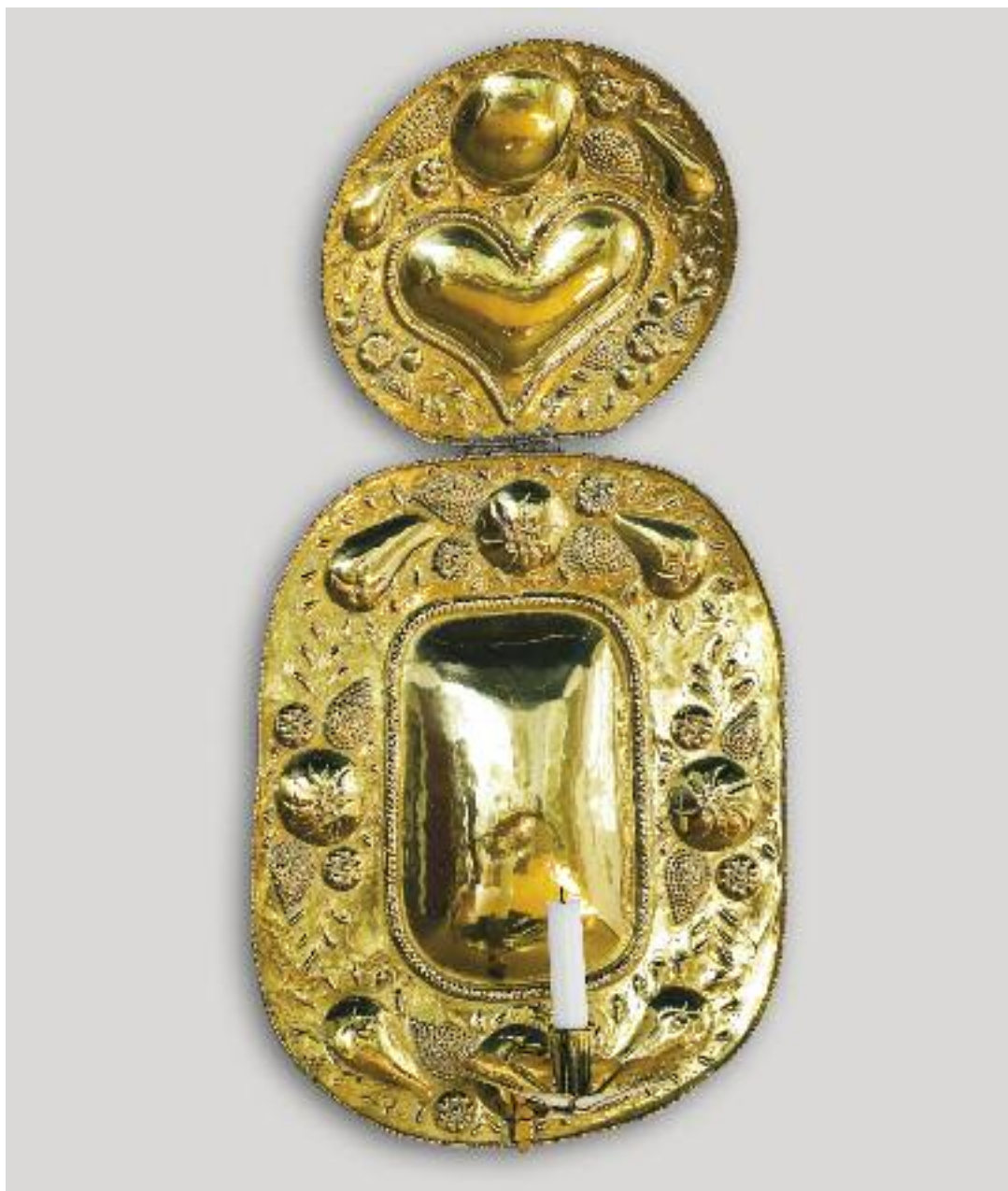
Lysskjold i gavlstuen mod Puggardsgade. Det levende lys reflekteres i messingoverfladen og kastes ud i rummet.