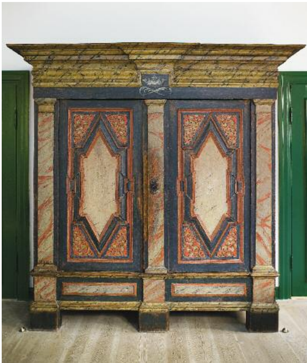
Brorsonstuen, skab fra begyndelsen af 1700-tallet, har stået på herregården Trøjborg, mens Brorsons mor- broder var amtsforvalter der.