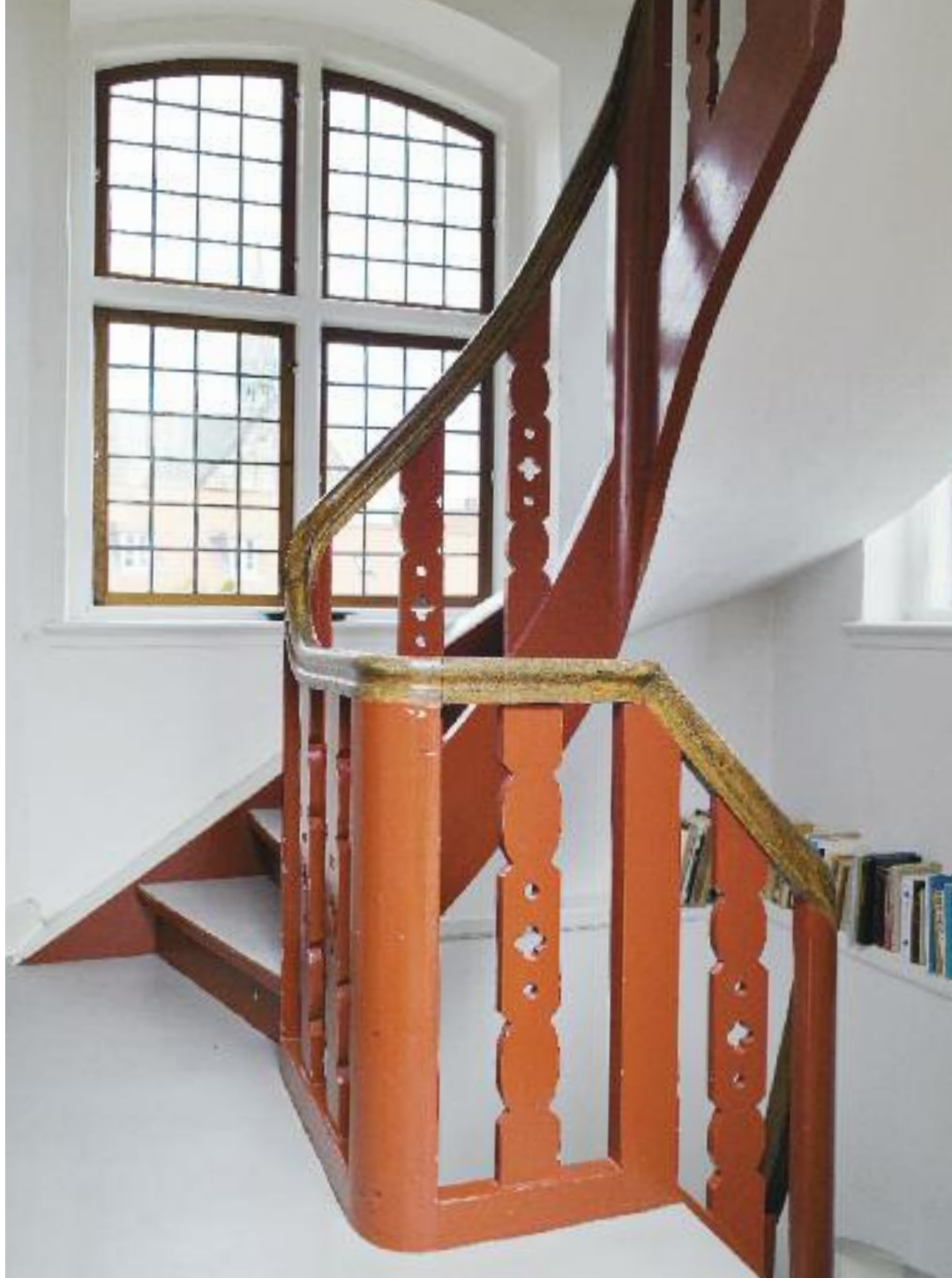
Bagtrappe i husets østlige ende, der blandt andet giver adgang til køkkenet.